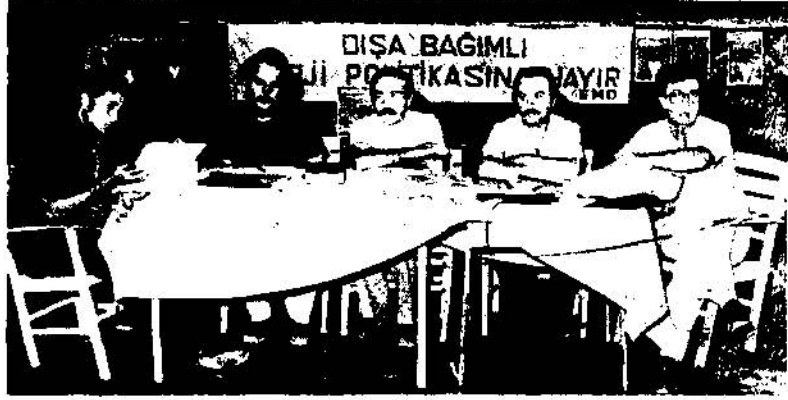
Anamur'da yapılan NES panelinden bir görünüm. 8 Eylül 1979

vb. problemlerin enine boyuna oşünümediği ve mevcut kaynaklar, su ve linyit potansiyelini değerlendirmek için kullanılması Nükleer Santralın 1995'lerde devreye girecek şekilde ötelenmesi idi.