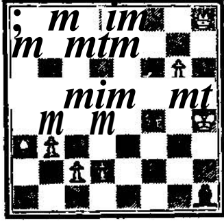
ÜÇ HAMLEDE MAT