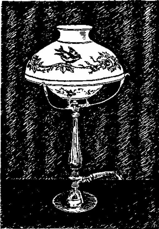
Resim 1. Havagazı ile yanan masa lâmbası.

Aşağıda izah edilen sebeple başlangıçta bazı yerlerdeki elektrik üretim ve dağıtım imtiyazlarında havagazı şirketlerine verilmişti.