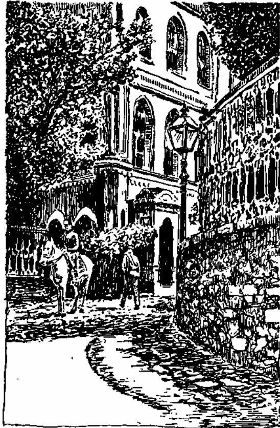
Resim 2. Taksim Topçu Kışlası köşesindeki havagazı feneri