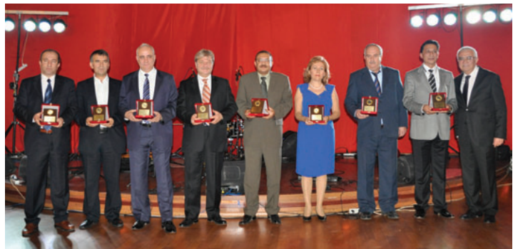
Meslekte 25 yılını tamamlayan üyelerimiz