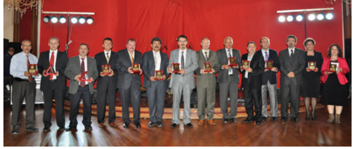
Meslekte 25 yılını tamamlayan üyelerimiz

400'e yakın konuşğun olduğu gecede, üyelerimiz ve yakınları canlı müziklere eşlik ederek eğlendiler.