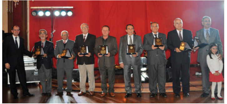
Meslekte 40 yılını tamamlayan üyelerimiz