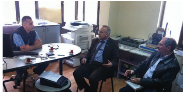
Didim İlçe Temsilciliği