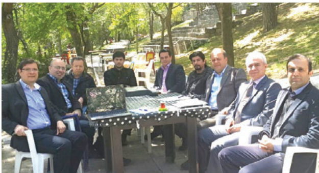
Bergama İlçe Temsilciliği