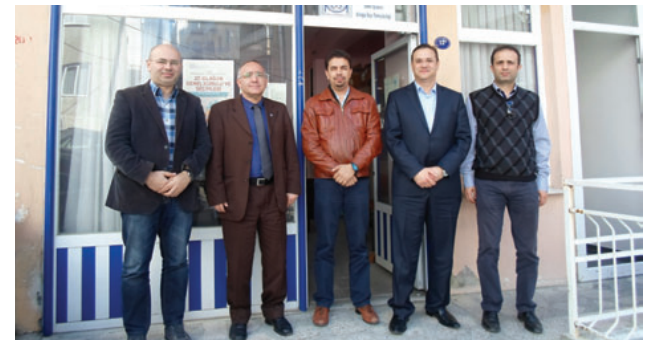
Aliağa İlçe Temsilciliği