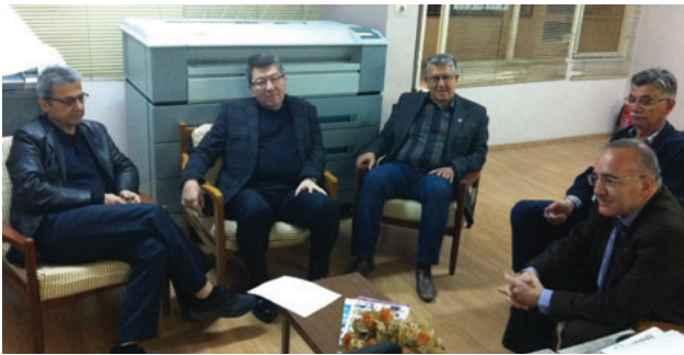
Söke İlçe Temsilciliği

Toplantılarda ayrıca katılımcılara Şube çalışmaları, İSG mevzuatı, SMM ve mesleki denetim uygulamaları ile