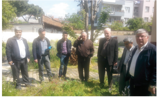
Ödemiş İlçe Temsilciliği