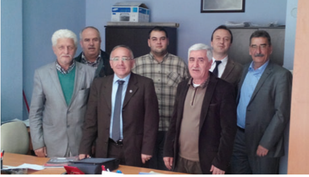
Turgutlu İlçe Temsilciliği

ilgili bilgi verilirken, katılımcılar tarafından genel olarak ekonomik daralmanın yarattığı yatırım azlığının bu alanda çalışan üyelerimizi ekonomik yönden sıkıntıya düşürmekte