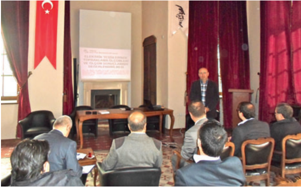
Bergama İlçe Temsilciliği

Eğitimlerde ayrıca konuyla ilgili yönetmelik ve standartlara rağmen çeşitli kurum ve kuruluşlarda üye-lerimizden konuyla ilgili tasarım, projelendirme, ölçüm ve raporlama vb hizmetlerin yürütülmesinde yönetmelik dışı şartlar öne sürüldüğü, bu durum karşısında Odanın girişimde bulunması gerektiğinin önemli olduğu vurgulandı.