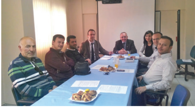
Manisa İl Temsilciliği

olduğu, azalan gelirleri nedeniyle üyelerimizin kurallara uymama, haksız rekabetin gelişmesi ve bazı çevrelerin çıkarlarına uygun olarak Oda denetimine karşı çıkılması sonucunu yaratmakta olduğu dile getirildi. SMM üyelerimiz çalışmalarını yürüttükleri yerler arasında elektrik dağıtım şirketi biriminde mühendis görevlendirilmesi, elektrikle ilgili fen adamlarının mevzuat çerçevesinde kendilerine tanınmış yetkileri üzerinde hizmet üretme istekleri, YG elektrik tesislerinde işletme sorumluluğu hizmetlerinin yaygınlaştırılması, sözleşmelere ilişkin Oda onaylarının ilçe temsilciliklerinde de yapılabilmesinin sağlanmasına yönelik altyapının oluşturulması gibi sorunları aktararak, anılan sorunların çözümü noktasında Şube Yönetim Kurulu'nun ilgili kurumlar nezdinde gerekli girişimlerde bulunmasını istediler.