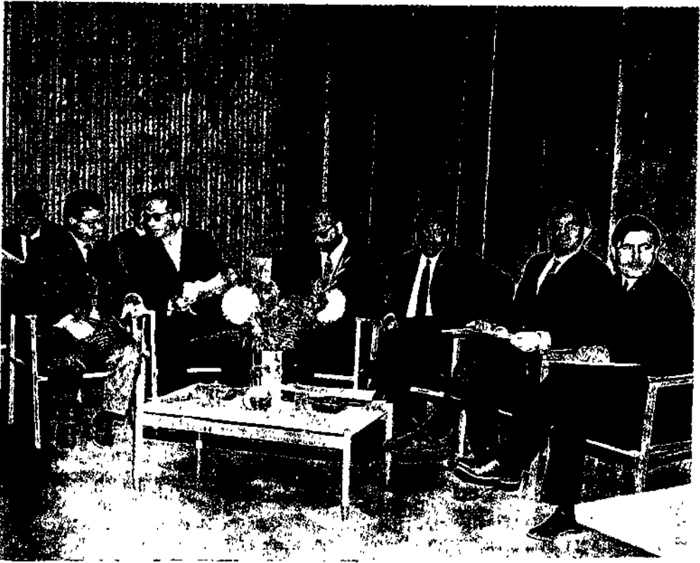
Kongreyi ilgi ile takip eden Bakanlar ve davetliler