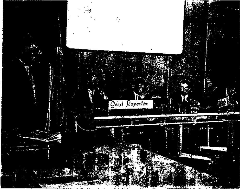
Enerji ve Tabii Kaynaklar Bakan-Sayın Be/et SEZGİN konuşmasını yaparken

«— Sayın Başkan ve muhterem davetliler Elektrik Mühendisleri 3. Teknik kongresinin sizlere ve yurdumuza hayırlı ve uğurlu olmasını