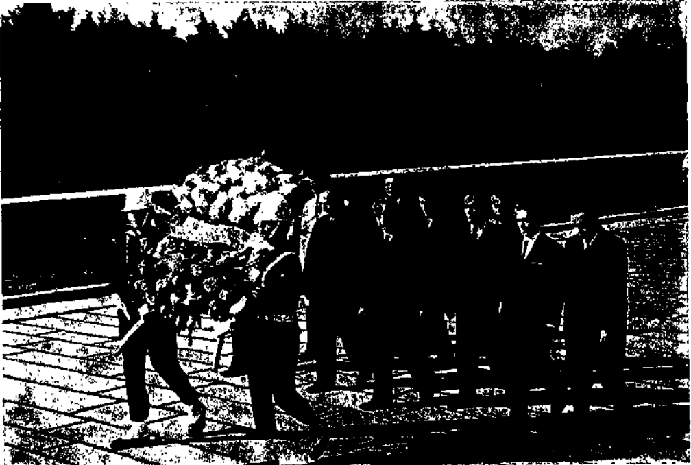
J/7. Teknik kongre üyelerinden bir heyet Ata'nın husmrun'a doğru giderlerken

Konuda canlılık yaratmak bakımından, genel raportörlerin, raporlarını okuma, tarzının da büyük tesiri olduğu inkâr edilemez. Kelime, cümle ve manâya önem vermeyen, uzun oldukça daha iyi incelenmiş bir rapor sunmuş olacağı kanısında olan kimsenin renksiz, cansız ve sıkıcı okuması ile, elindeki metni kısa da olsa, kelimeleri değerlendirerek, manâyı ve dinleyiciler üzerindeki etkisini yakından izliyerek sunan iki raportör arasındaki basan farkı büyük oluyor.