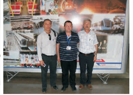
İzmir Metro A.Ş.-11 Mayıs 2010