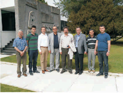
Manisa OSB Müdürlüğü