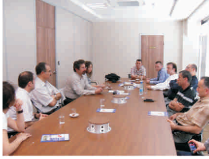
Schneider Electric A.Ş.-6 Mayıs 2010