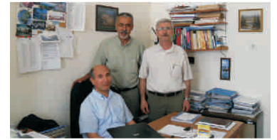
EU Meslek Yüksekokulu