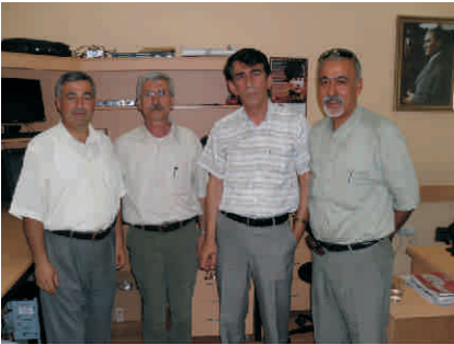
Ege Üniversitesi Rektörlüğü

Öğrenci İşleri Bölümü ve Bilgi İşlem Daire Başkanlığı