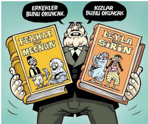
Karikatürler: LeMan ve Uykusuz

• Kız ve erkek öğrencilerin aynı yurt, aynı yemekhane ve hatta aynı merdivende bulunmasını sakıncalı bulup engelleyen kafa, sonunda ağzındaki "peynir"i düşürdü. AKP milletvekili Sadık Yakut, karma eğitimin büyük bir yanlışlık olduğunu ve bunun düzeltileceğini söylerken, Milli Eğitim Komisyonu başkanı Fikri Aşık da karma