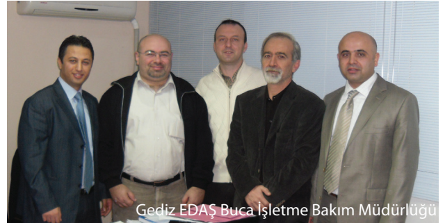
Gediz EDAŞ Buca İşletme Bakım Müdürlüğü

Kon-Tek Otomasyon firması ziyaretinde otomasyon alanında şube çalışmaları ve enerji alanındaki uygulamalar hakkında görüş alışverişinde bulunularak Kasım ayında Şubemizde gerçekleştirilecek Elektrik Tesisat Ulusal Kongresi hakkında bilgi verildi.