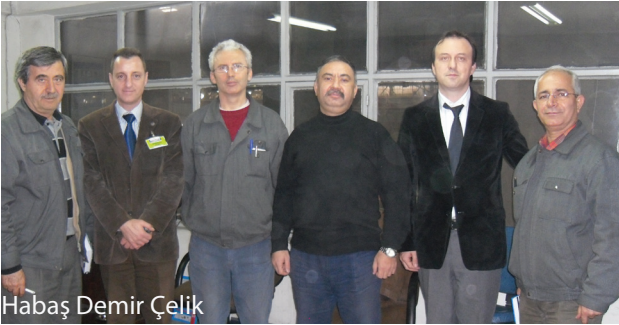
Habaş Demir Çelik