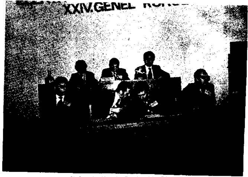
24.Genel Kurul Başkanlık Divanı

Yılda 75 milyar kWh olan hidrolik potansiyelimizin % 10'u bugün kullanılmaktadır. Halen kurulmakta olan hidro-elektrik tesisler gözönüne alındığında; IV.Beş Yıllık Plan dönemi sonunda bu oran % 14,2'ye yükseltilmek üzere çalışmaktadır.