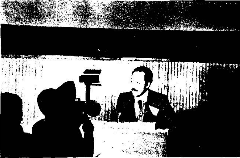
Ungan: "teknik elemanların politikadan uzak durmaları yolundaki telkinleri anlaşılabilir bulmuyoruz"

ODAMIZ 24, MERKEZ GENEL KURULU 24-26 ŞUBAT 1978 GÜNLERİ ANKARA'DA IMAR VE İSKÂN BAKANLIĞI TOPLANTI SALONUNDA YAPILDI ÜLKE VE MESLEK SORUNLARININ TARTIŞILDIĞI/ YENİ YÖNETİCİLERİN BELİRLENDİĞİ GENEL KURUL ÇALIŞMALARINA İLİŞKİN HAŞERLERİ YAPILAN KONUŞMALAR, ALINAN KARARLARI AYRINTILI OLARAK VERİYORUZ