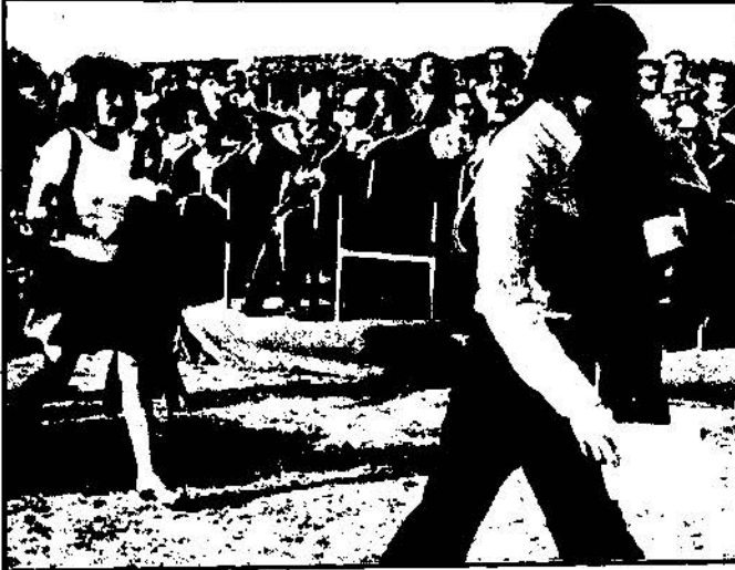
"Emperyalizmin kültürünün simgesi olan bu cübbeleri giymeyeceğiz."

Orta Doğu Teknik Üniversitesinde 28 haziran günü yapılan diploma töreni sırasında, mezunlar "emperyalizmin kültürünün simgesi" olarak niteledikleri cübbeleri giymediler. Öğrencilerin, özerk ve demokratik üniversite isteyen ve ODTÜ yöneticilerini sermaye çevrelerinin işbirlikçisi olarak suçlayan protestoları karşısında, diploma töreninin yapıldığı stadyum jandarma kuvvetleri tarafından sarıldı. Üniversitedeki tek demokratik öğrenci örgütü olan ODTÜ Mimarlık Fakültesi Öğrenci Derneğine de söz hakkı verilmeyen töreni, öğrenciler, "jandarma gözetiminde diploma almayı reddettiklerini" söyleyerek terkettiler.