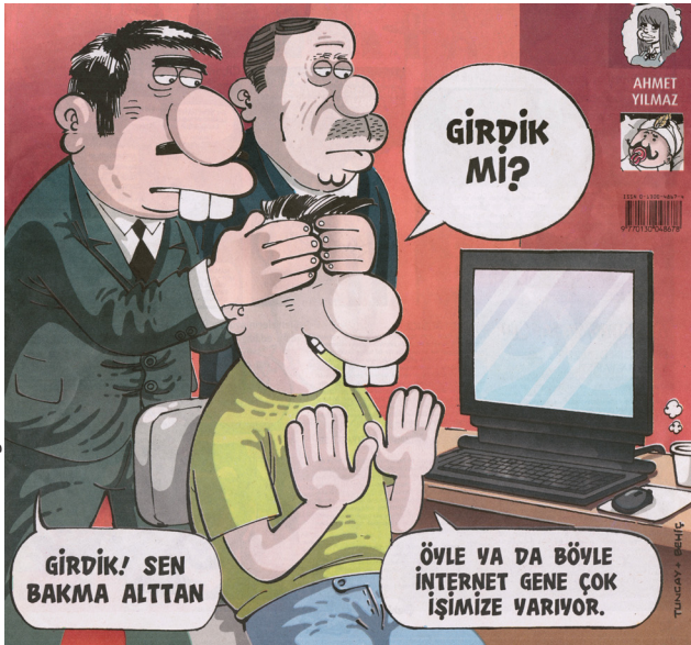
Karikatür: Leman Dergisi