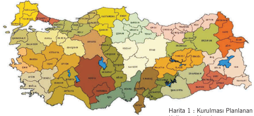
Harita 1 : Kurulması Planlanan Kalkınma Ajansları

yönetmelikler "Kalkınma Ajanslarının Çalışma Usul ve Esasları Hakkında Yönetmelik", "Kalkınma Ajansları Personel Yönetmeliği" 25 Temmuz 2006 tarih ve 26239 sayılı Resmi Gazetede, "Kalkınma Ajansları Bütçe ve Muhasebe Yönetmeliği" 28 Eylül 2006 tarih ve 26303 sayılı Resmi Gazetede, "Kalkınma Ajansları Proje Ve Faaliyet Destekleme Yönetmeliği" 8 Kasım 2008 tarih ve 27048 sayılı Resmi Gazetede, "Kalkınma Ajansları Proje ve Faaliyet Destekleme Yönetmeliğinde Değişiklik Yapılmasına Dair Yönetmelik" 12 Nisan 2009 tarih ve 27198 sayılı Resmi Gazetede, "Kalkınma Ajansları Denetim Yönetmeliği" 3 Ağustos 2009 Tarih ve 27308 sayılı Resmi Gazetede yayımlanarak yürürlüğe girmiştir. Ayrıca bu süreçte Kalkınma Ajanslarının sayılarını düzenleyen