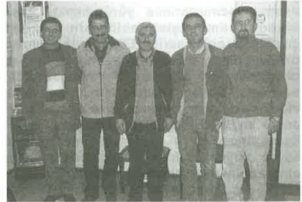
EMO Turgutlu İlçe Temsilciliği ziyareti

Üye toplantıları sırasında genel olarak mesleki denetim sırasında fatura denetiminin yapılmaması nedeni ile yaşanan haksız rekabet uygulamaları, TUS uygulamasının Manisa ilinde sürmesi nedeni ile YG Tesislerinde İşletme Sorumlusunun TEDAŞ birimleri tarafından takip edilmemesi, birimlerin eksik tip projelerinin tamamlanması talebi, belediye tarafından verilen temel üstü vizesi sırasında temel topraklamasının TUS tarafından kontrolü, Kuvvetli Akım Tesisleri Yönetmeliği değişikliği sonrasında yaşanan sorunlar ve Temsilcilik demirbaş istemleri görüşüldü.