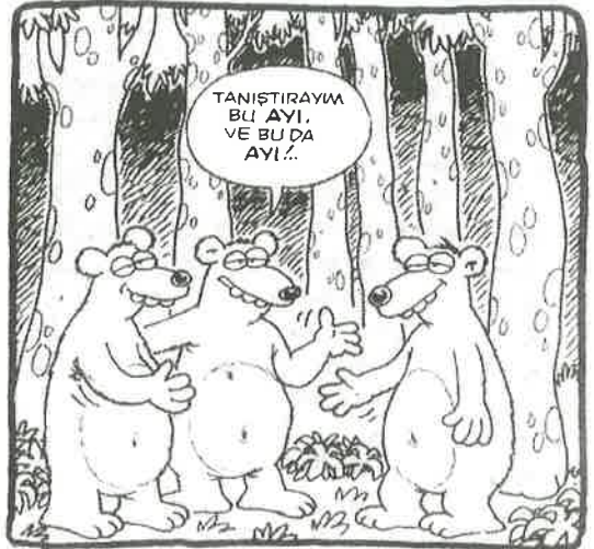
Karikatür: Selçuk Erdem