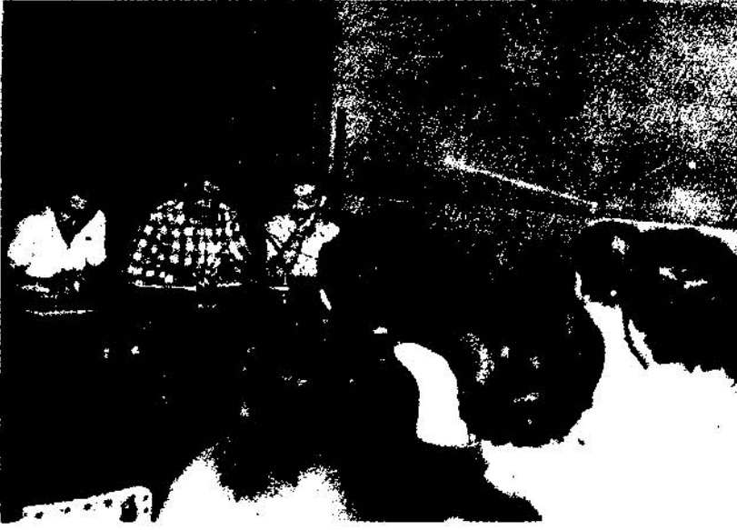
Teknik elemanlar ve tüm sendikası çalışanlar Grevli, Toplu Sözleşmeli Sendikalar için daha etkin mücadelede kararlıdır.

haie getirilerek işyerlerine yaygınlaştırılması toplantılara katılanlar tarafından ısrarla önerildi.