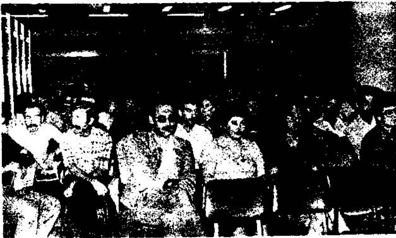
TMMOB Uyarı - Tartışma Toplantılarından bir görünüm (TEK İşyeri)

Üyelerimizin de yoğun olarak bulunduğu, işyerine özgün somut sorunların da tartışıldığı bu tür toplantıların belli bir periyodla sürekli