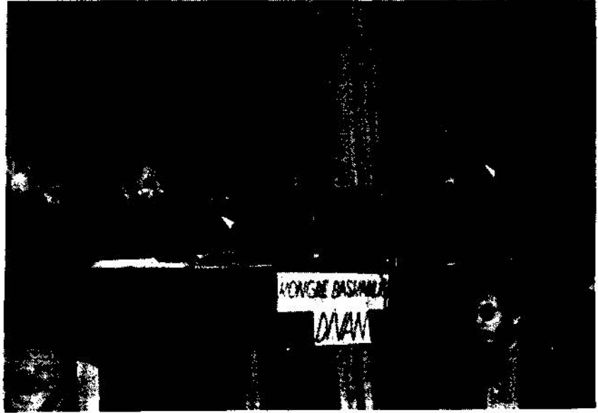
İstanbul Şubesi Genel Kurul Başkanlık Divanı.