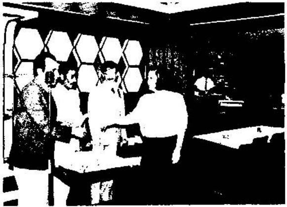
Odamızın 30. kuruluş yılı kutlamalarından bir görüntü.

İzmir Şubesi'nde Çeşitli dönemlerde yönetim kurulumuzda görev alan 45 üyemizin eşleriyle birlikte katıldığı gecede kendilerine yönetici olarak Şubemize yaptıkları hizmetlerden dolayı ONUR belgeleri dağıtıldı.