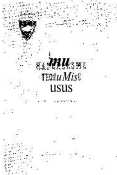
KHT* Haberteşme Teorilerine Giriş