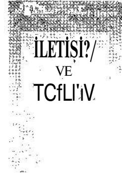
İletişim ve Toplum