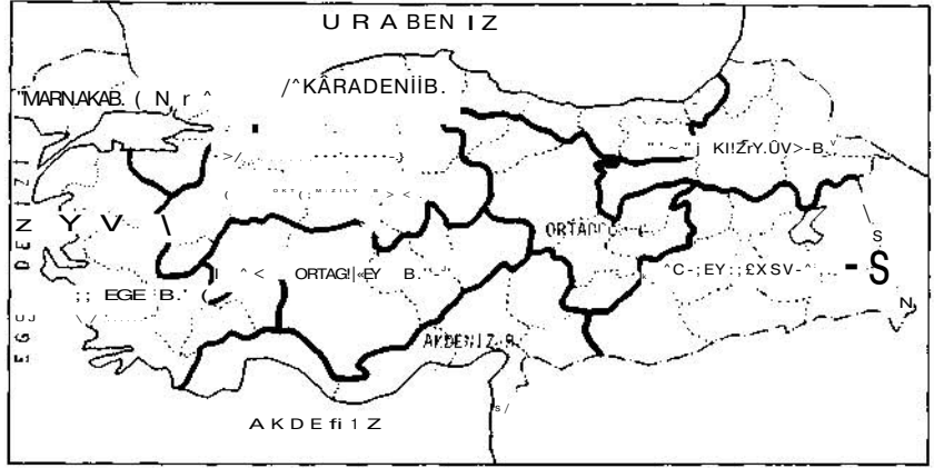
PLANLI DÖNEMDE TOPLAM MEVDUAT ve KREDİLERİN BÖLGESEL DASILIMI (+)OLANAK

(Kaynak: Özcan Ertuna, Planlı Dönemde Toplam Mevduatın ve Toplam Kredilerin Bölgesel Dağılımı, T.C. Başbakanlık Devlet Planlama Teşkilatı Yayın No DPT: 1477-KÖD:17, Mart 1976)